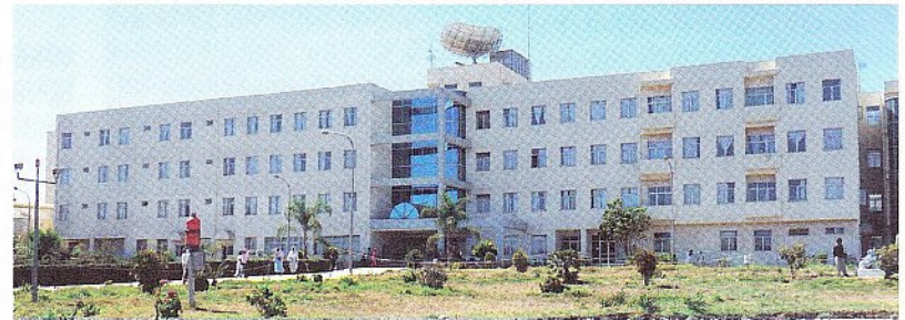
Im Hospital von Asmara operierten die Deutschen Herzpatienten. Gerfried Tschebull oblag die Nachbehandlung.

HeartHelp im Mai 2008, um vier Patienten an den Herzklappen zu operieren, wozu sie fast das ganze Material aus Deutschland mitbringen mussten. Im Jänner 2009 folgte der nächste Einsatz, wieder im Orotta Referral Hospi-