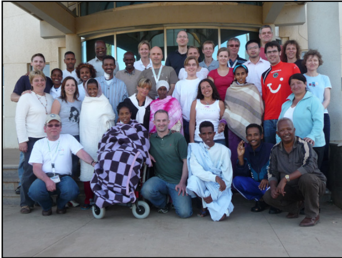
Das Team im Januar 2009 mit Patienten

Wer hat das Projekt „HeartHelp“ gegründet? Ärzte und Pflegekräfte der Medizinischen Hochschule Hannover.